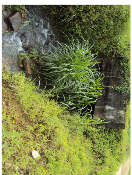
Riacho do Zéfê