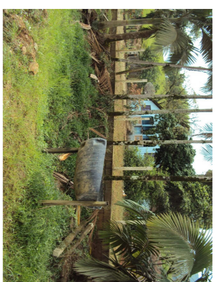
Local para travessia da tubulação