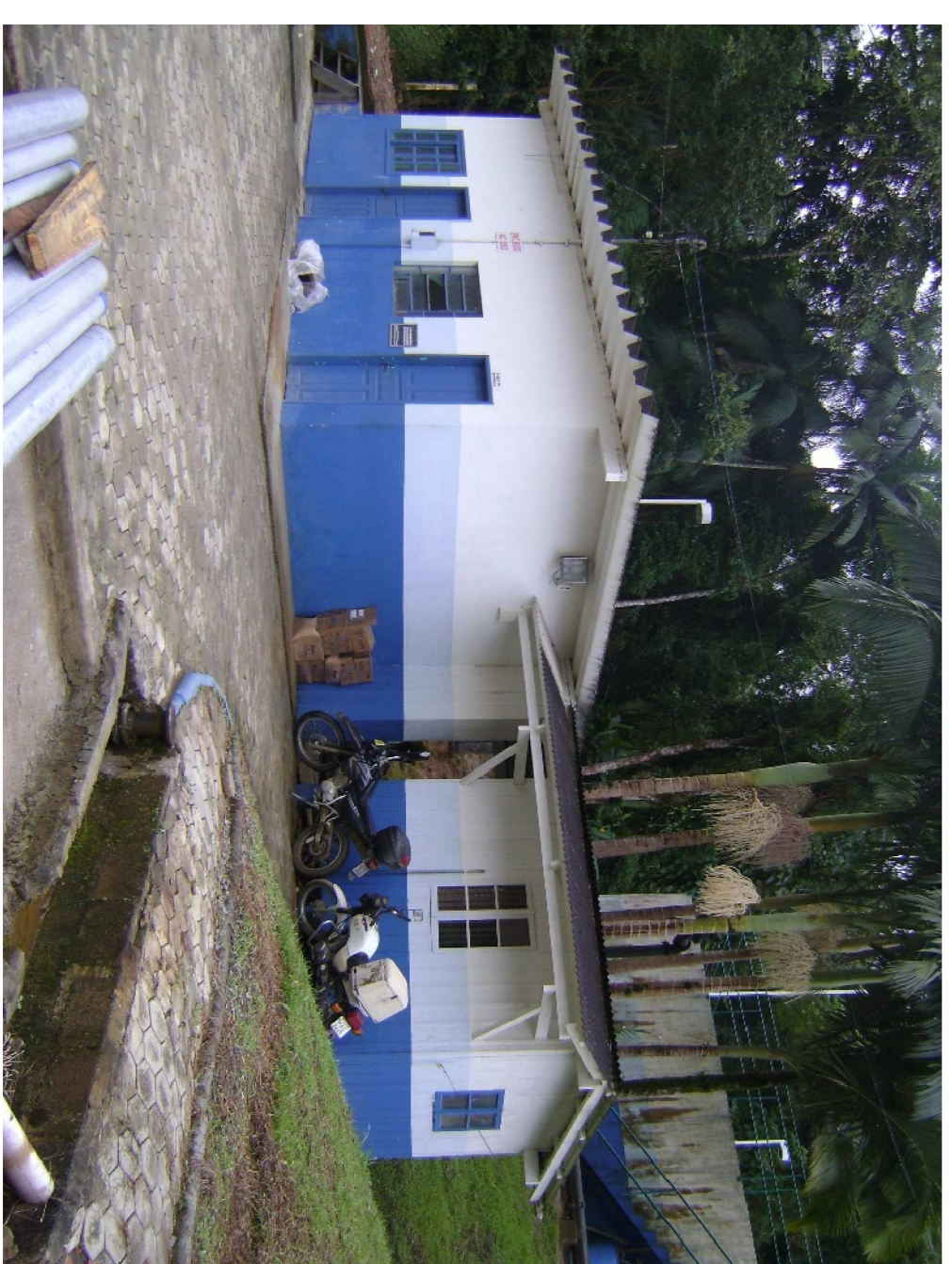
Foto da Casa da ETI atual - vista lateral direita