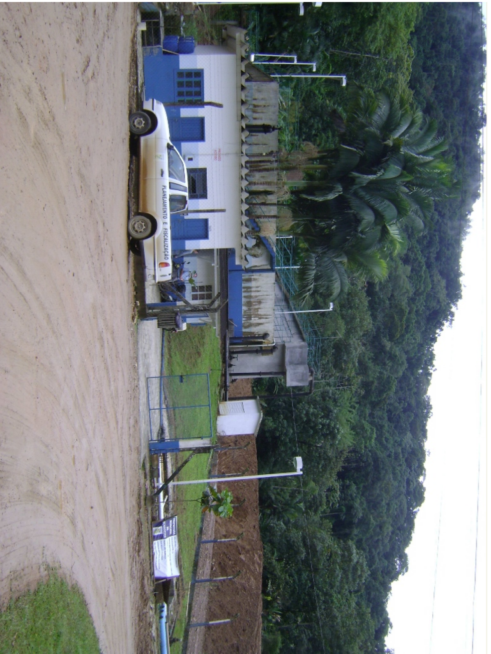
Foto da casa de ETI atual - vista frontal