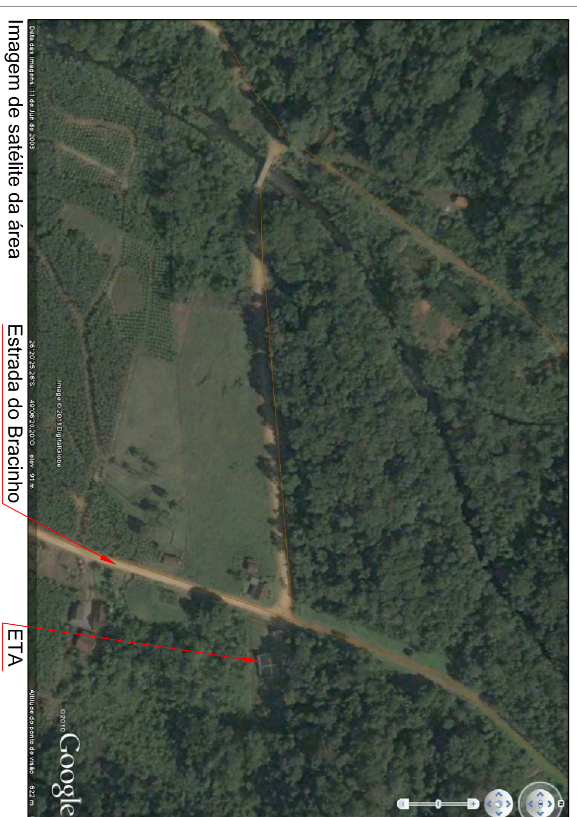
Imagem de satélite da área